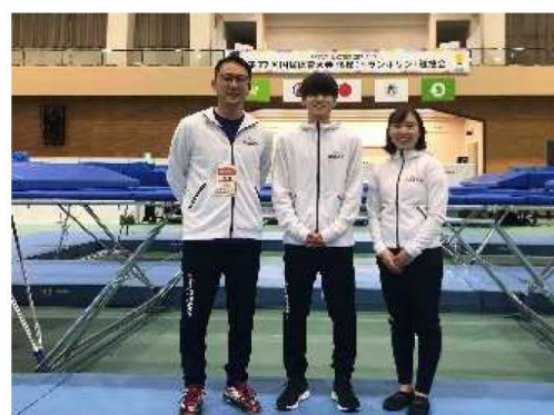
トランポリン男子 優勝